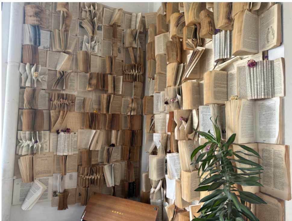
Sifra Alternative Space, Addis Abeba, Mai 2026.