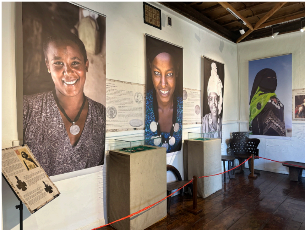
Yimtubezina Museum, Addis Abeba, Mai 2026.