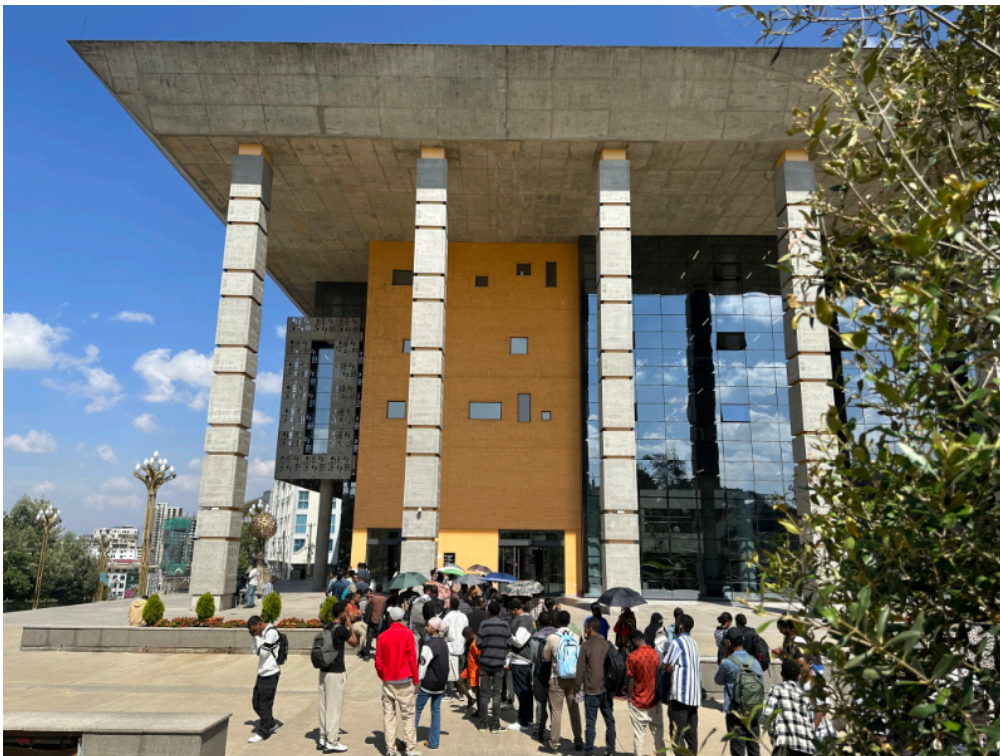
Abrehot Library, Warteschlange vor dem Eingang zur Bibliothek am Patriot's Day, Addis Abeba, 5. Mai 2026.